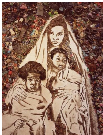
Vik Muniz. Da série lixo extraordinário .