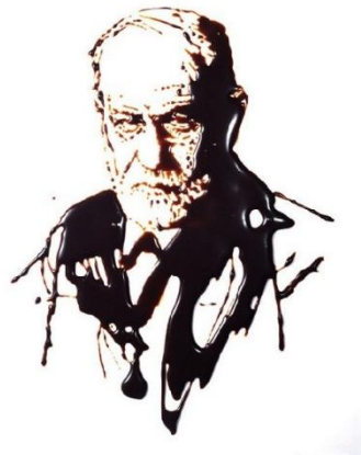
Vik Muniz. Sigmund Freud . Chocolate.