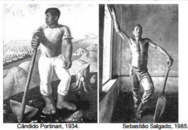
Cândido Portinari, 1934.

QUESTÃO 10. Analise as figuras para responder à questão.